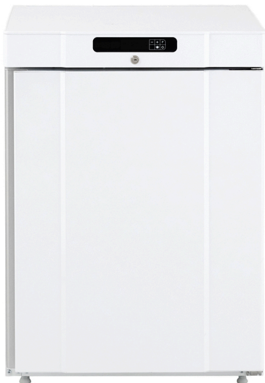
TABLE TOP NEG. BLANC